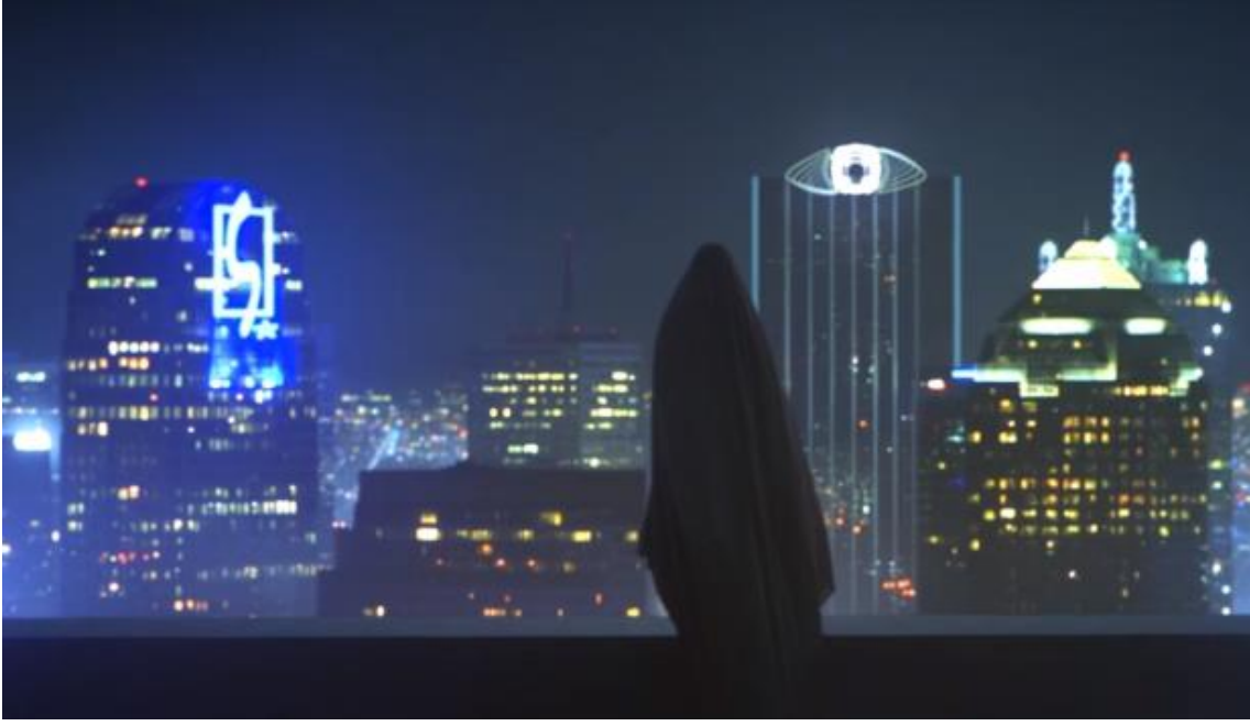
Kadim “Tanrı’nın Gözü”yle bakışan C.

Contact isimli romanıyla yer alan ve insanlığa zamanın ve uzayın sırlarını açıkladığı Cosmos belgeselini hazırlayan Carl Sagan ’a bir gönderme olmalıdır (Buradaki C’lerin anlamlı uyumu da gözden kaçmamalı: Carl/Contact/Cosmos). Sonuçta hayalet C de bizi zamanda ve uzayda sonsuz bir yolculuğa çıkarıyor, umudun peşinde. Diğer taraftan C ve M harfleri, bu karakterleri canlandıran oyuncuların isimleriyle de uyumludur; C’yi canlandıran Casey Affleck ’in adının baş harfi C; M’yi canlandıran Rooney Mara’nın da soyadının baş harfi M’dir.